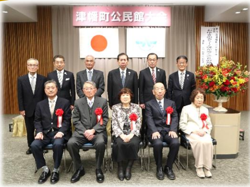
受賞者と来賓の皆さん

3月1日（日）津幡町文化会館シグナスにて第71回津幡町公民館大会を開催いたしました。津幡町社会教育功労者表彰では、長年にわたり社会教育の発展に貢献されている5名の方が表彰されました。受賞おめでとうございます。