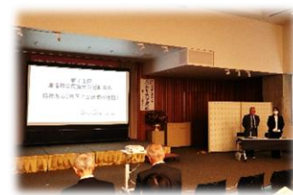
津幡町条南公民館 活動発表