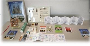
巡礼路のスタンプやお土産品