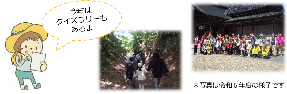
※写真は令和6年度の様子です

倶利伽羅地区体育協会、刈安公民館と共同で開催しています。津幡町観光ボランティア「つばたふるさと探偵団」と倶利伽羅の歴史を感じられる旧跡を巡ります。楽しくウォークして、倶利伽羅地区の親交を深めましょう。