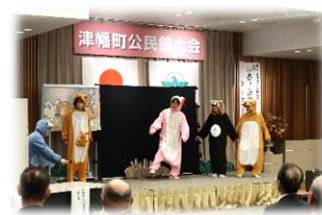
小矢部市立津沢公民館 紙芝居劇団モコモコぐるーぷ 大型紙芝居「月のうさぎ」上演