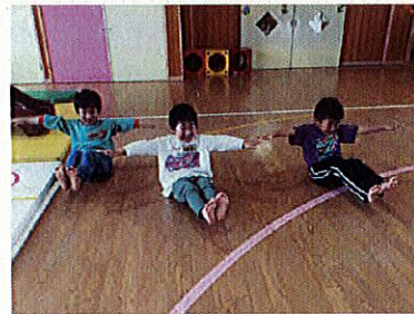
お腹に力を入れてV字バランス