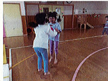
お友達を見つけて…ハイタッチ！ジャンプ！