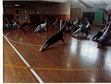
色々なポーズに挑戦！飛行機のポーズ

運動を教えてくれるのは「ひなこ先生」です。先生とげんきっ子での3つのお約束をしました。①お話を最後までしっかり聞く②ふざけない③諦めないで最後まで頑張る