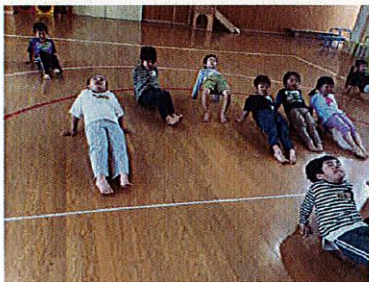
腕にギュッと力を入れて、滑り台のポーズ