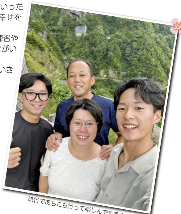
旅行であちこち行って楽しんでいます♪(本人右)