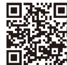
認証キーの取得方法 発注者への提出方法