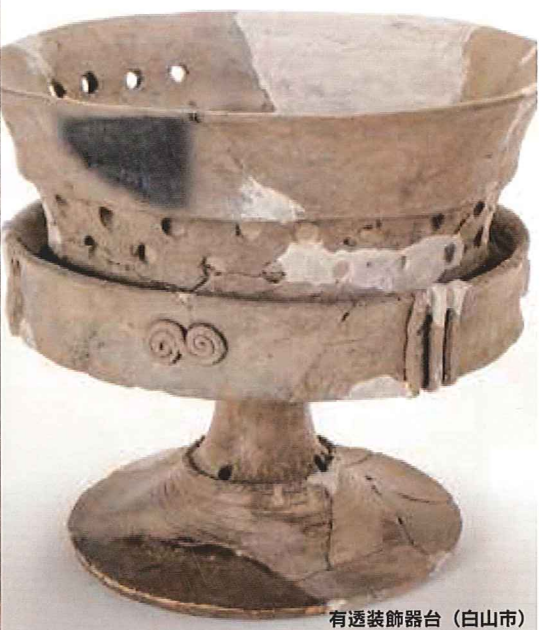
有透裝飾器台 (白山市)