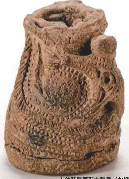
人体裝飾筒形土製品 (かほく市)