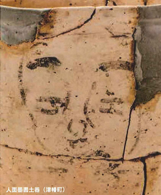
人面墨書土器 (津幡町)