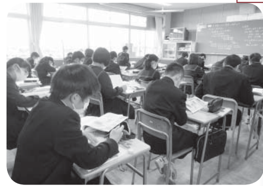
▲熱心に学ぶ生徒たち

令和3年度からの教科書改訂に伴い、中学校全科の教師用教科書・指導書・デジタル教科書を購入する。