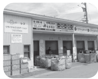
▲分別をしっかりしようね

強風などにより、ごみが散乱しないよう、つばたRecocoに、シャッターや防犯カメラを取り付ける工事費用。その他、管理業務委託料の増額見込み費用。