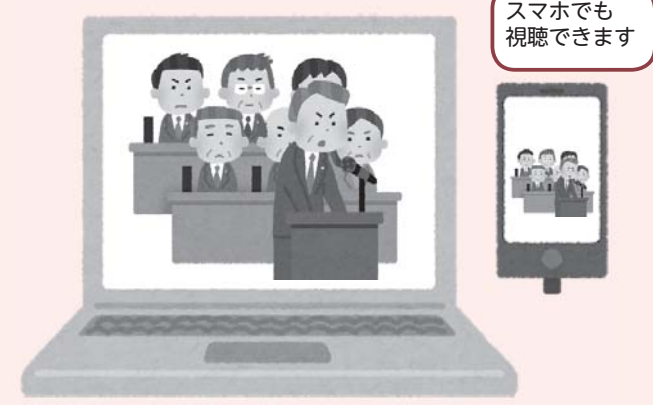
スマホでも視聴できます

お知らせ 今回は、新庁舎竣工にあわせて公開する新しいホームページの準備期間中のため、QRコードの掲載を省略しております。ご了承ください。